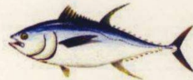
Thunnus albacares RABIL 3,2 Kg