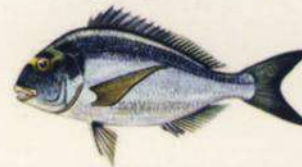
Sparus auratus DORADA - SAMA ZAPATA 19 cm