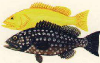
Myxeroperca fusca ABADE - GITANO 35 cm