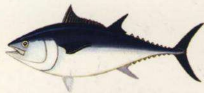
Thunnus thynnus PATUDO - ATÚN ROJO 6,4 kg - 30 kg* / 115 cm *Reglamento CE 1559/2007