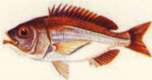
Dentex macrophthalmus ANTOÑITO - CACHUCHO 18 cm