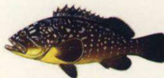
Epinephelus marginatus MERO - MERO MORENO 45 cm