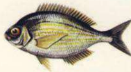
Spondyliosoma cantharus CHOPA - NEGRÓN 19 cm