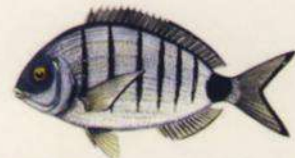
Diplodus sargus cadenati SARGO - SARGO BLANCO 22 cm