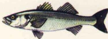
Dicentrarchus labrax LUBINA 22 cm