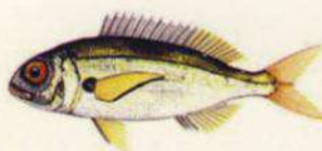
Pagellus acarne BESUGO - ALIGOTE 12 cm