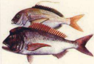
Dentex gibbosus PARGO - SAMA DE PLUMA 35 cm