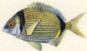
Diplodus vulgaris SEIFÍA - MOJARRA 22 cm