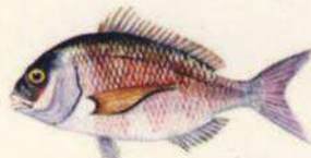
Pagrus pagrus BOCINEGRO - PARGO 33 cm