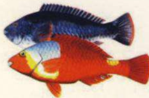
Sparisoma cretense VIEJA - LORO VIEJO 20 cm