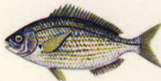
Sarpa salpa SALEMA 24 cm