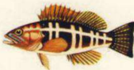
Serranus atricauda CABRILLA - SERRANO IMPERIAL 15 cm