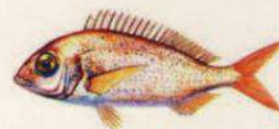
Pagellus erythrinus BRECA - PAGEL 22 cm