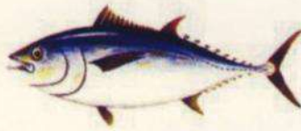
Thunnus obesus TUNA - PATUDO 3,2 Kg